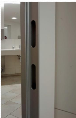
Türanschlag mit Gummidichtung