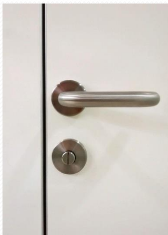
Schlichte Fuge durch Flächenbündige Profile